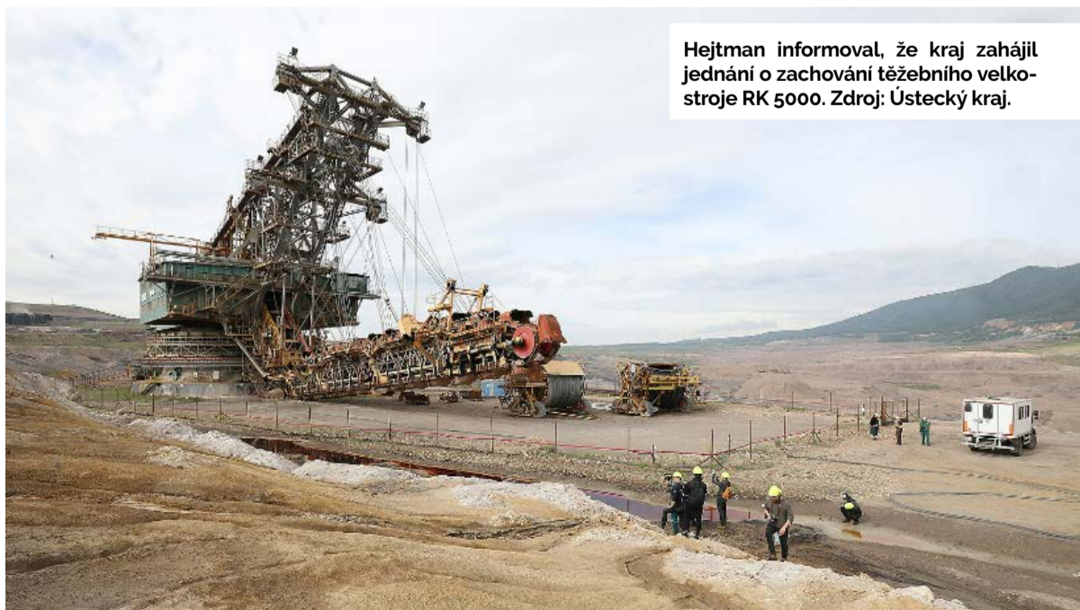
Hejtman informoval, že kraj zahájil jednání o zachování těžebního velkostroje RK 5000.

Účastníci se také dozvěděli o probíhajících či připravovaných projektech kraje. Ten chce například rozšířit zahradu a parkoviště Domovů sociálních služeb v Janově, přistavět patro k objektu SOŠ Litvínov – Hamr či rekonstruovat Domov pro seniory v Meziboří částkou přesahující 100 milionů korun. Pokud jde o silnice, měla by se v letošním roce realizovat oprava povrchu průtahu Hamrem a sanace svahu na silnici III/2543 v Janově.