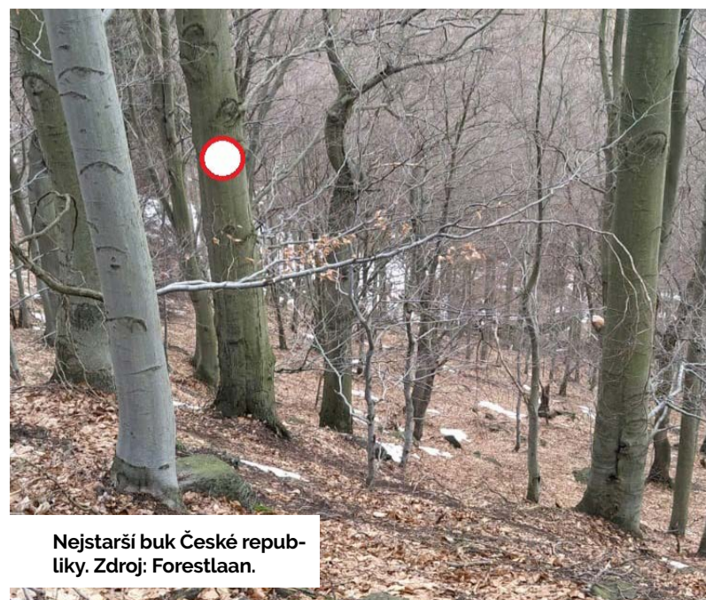
Nejstarší buk České republiky.

aktivity, inspiroval ho zápis jizerskohorských bučin na seznam přírodního dědictví UNESCO