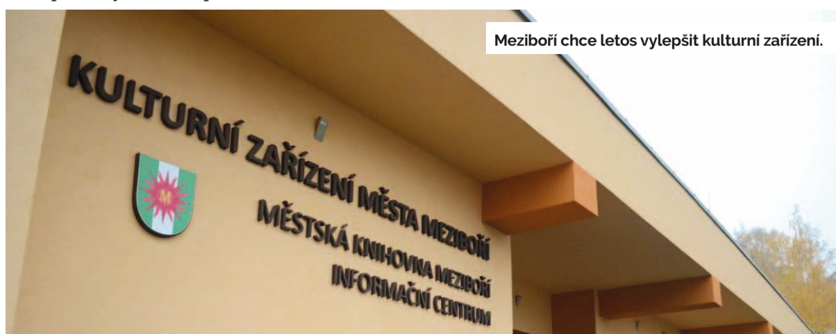
Meziboří chce letos vylepšit kulturní zařízení.

V loňském roce došlo k významným změnám v rozdělování daní ze státní úrovně, a to má přímý dopad na příjmy města. Kromě toho se potýkáme s trvale vysokými cenami energií, což představuje další výzvu pro udržitelné financování městské infrastruktury a služeb. Hlavním cílem vedení města je proto zlepšování kvality života v Litvínově, a to i v nových náročných ekonomických podmínkách a při stále přísnějších předpisech spojených s téměř všemi oblastmi rozvoje města. Vedení města bude v roce 2024 pokračovat ve financování klíčových projektů a zároveň intenzivně pracuje na získávání dalších finančních prostředků a dotací z různých státních i soukromých zdrojů. Jenom tak bude možné pokračovat v rozvoji a modernizaci infrastruktury a zlepšování kvality služeb poskytovaných obyvatelům Litvínova.